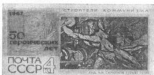
Проекты марок юбилейной серии «50 героических лет».