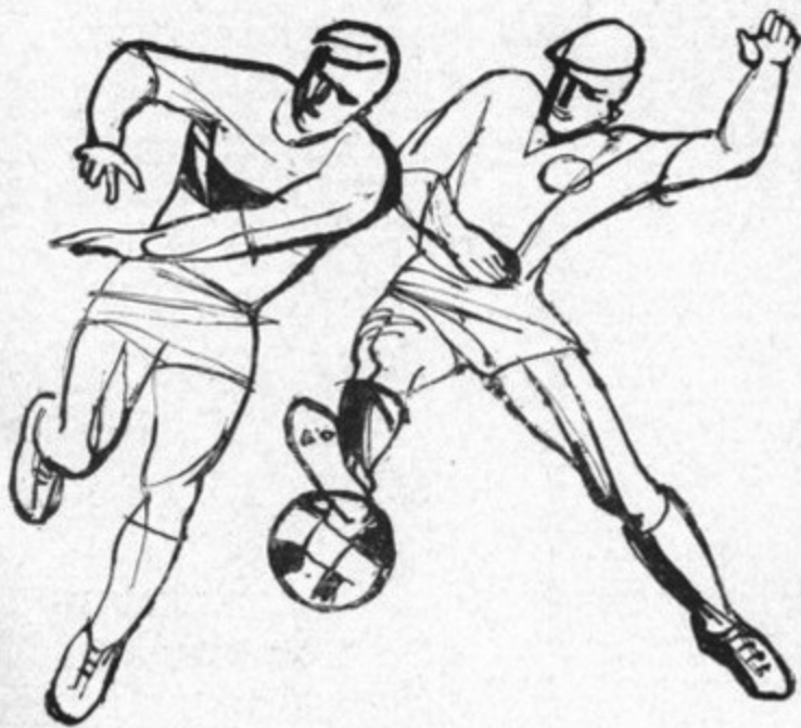
Кубок Жюля Римэ (Лондон, 1966)

В июле прошлого года любители спорта всех континентов следили за бурным развитием событий на стадионах туманного Альбиона. Как известно, там в восьмой раз скрестили футбольное оружие сильнейшие команды мира. Волновались не только болельщики, но и филателисты. Те и другие ожидали спортивного и дождались.